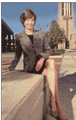
Фото из Dec. 2000 Scientific American (photo by Bill Pugliano)

( http://ai.eecs.umich.edu/people/conway/conway.html )