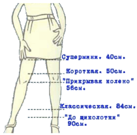
Возможные типы длин юбок: